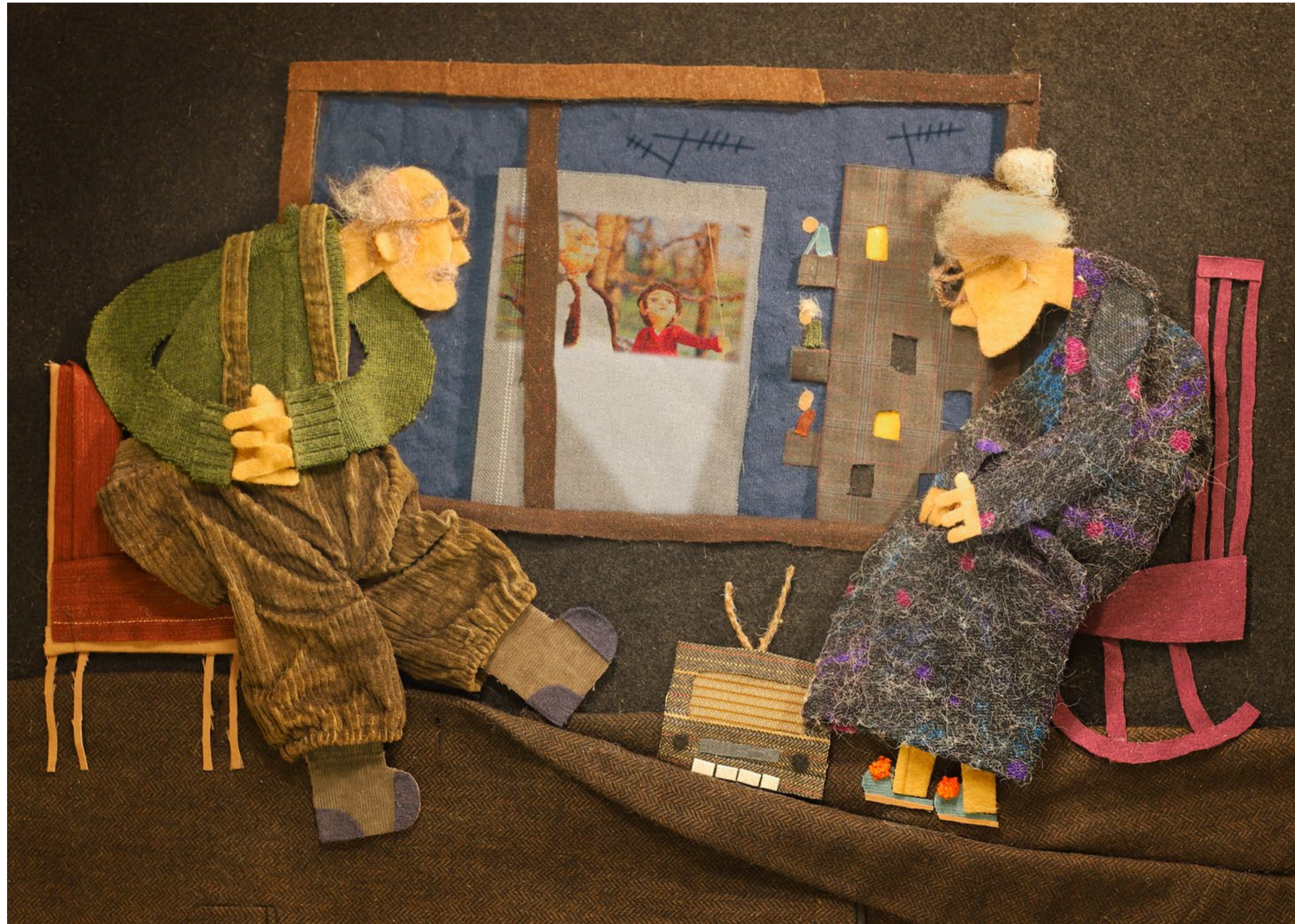
Domáce kino, 2021