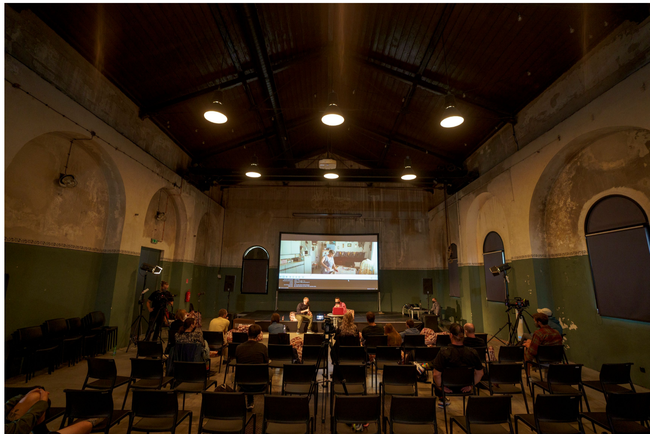
Medzinárodný filmový festival Cinematik Piešťany 2021

V roku 2021 sme zároveň rozšírili možnosti príspevkov z Fondu LITA pre členky a členov združenia. Tieto autorky a autori sa môžu od minulého roka uchádzať o príspevky na mobility – cesty spojené s prezentáciou ich diel a reprezentáciou slovenského umenia. Podpora je zameraná na prezentáciu slovenského umenia – napr. účasť na preberaní ocenení či prezentáciu diel na festivaloch a odborných podujatiach. Aj žiadosti o tieto príspevky posudzuje Výbor LITA a riaditeľka LITA na spoločných zasadnutiach. Napriek problematickej pandemickej situácii sa nám v roku 2021 podarilo podporiť cesty dvoch autorov príspevkami v celkovej výške 1 000 eur. Autorov a ich rodiny sme tiež podporili poskytnutím štyroch príspevkov zo sociálneho fondu v celkovej výške 5 000 eur.