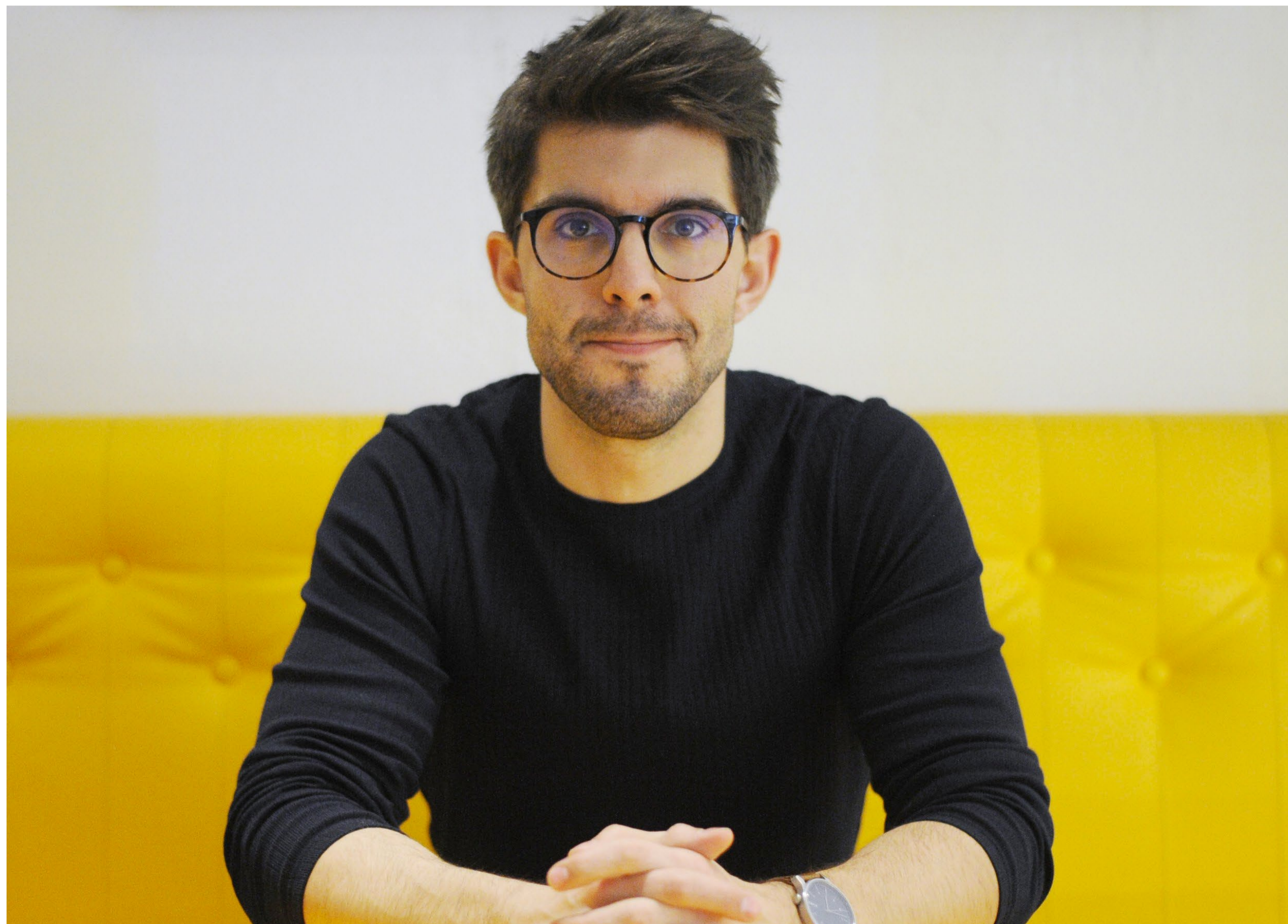
Martin Smatana