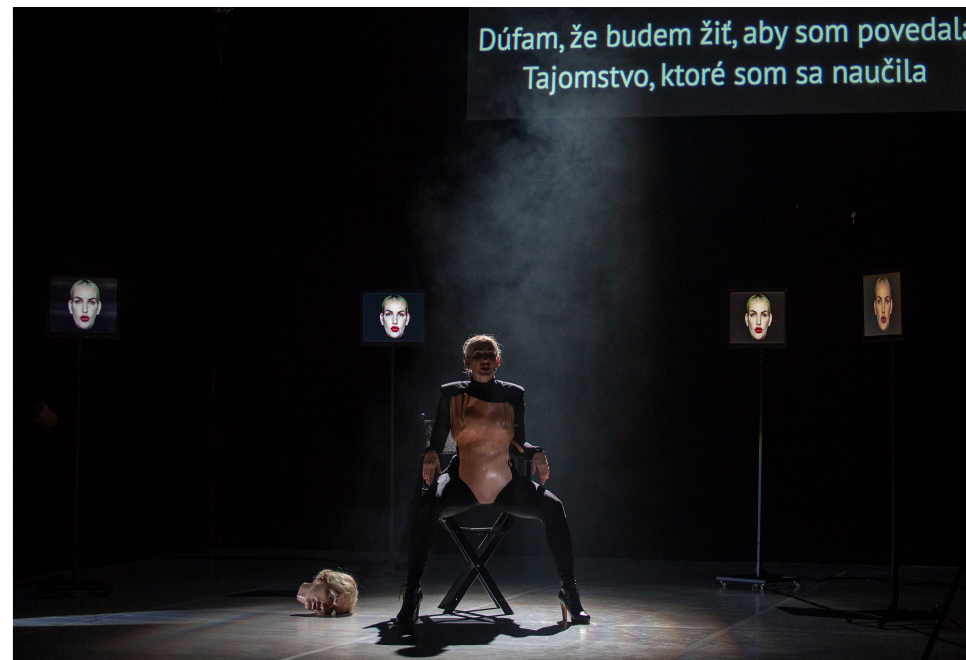
Medzinárodný festival Divadelná Nitra 2020

Časopis FRAKTÁL je štvrťročník pre literatúru a literárnu reflexiu s presahom do susediacich umeleckých oblastí a vedeckých disciplín s podtitulom „Literatúra horizontálne a vertikálne“. Odborné periodikum tvoria etablované autorky a autori, prekladatelia, kritici a vedci. Časopis sa usiluje o žánrovú i umeleckú pestrosť, názorovú pluralitu a umeleckú kvalitu – ale aj o bohatú skladbu rubriík a tematických blokov, ktoré reagujú na potrebné i provokatívne témy v literatúre a kultúre (aktuálne výročia a príležitosti, podujatia, infraštruktúrne otázky a i.). LITA v roku 2020 podporila vydanie posledného čísla časopisu v danom roku – 4. číslo s témou Priestory archívov.