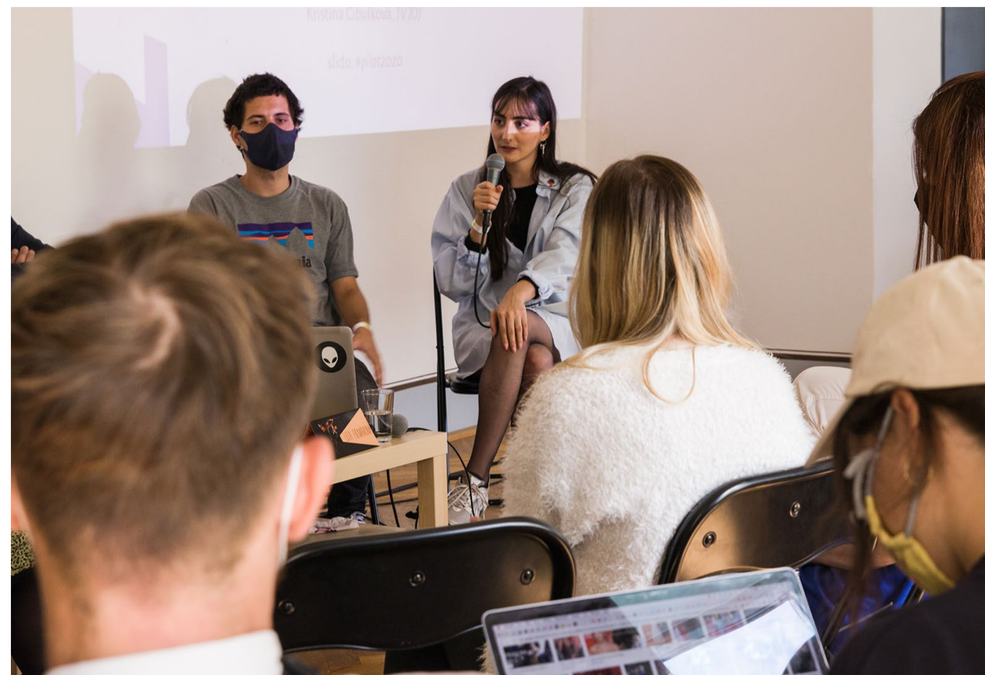
Festival seriálov Pilot 2020

Festival seriálovej tvorby Pilot je novinkou medzi slovenskými umeleckými odbornými platformami, v roku 2020 sa odohral jeho druhý ročník. Podujatie je svojím zameraním unikátom – skúma trendy a fenomény domácej aj zahraničnej seriálovej produkcie a distribúcie. Seriálová prehliadka podnecuje diskusiu o domácej tvorbe, o stave (a jeho príčinách) súčasného slovenského seriálu, do ktorej prizýva tvorcov aj kritikov z tohto odvetvia.