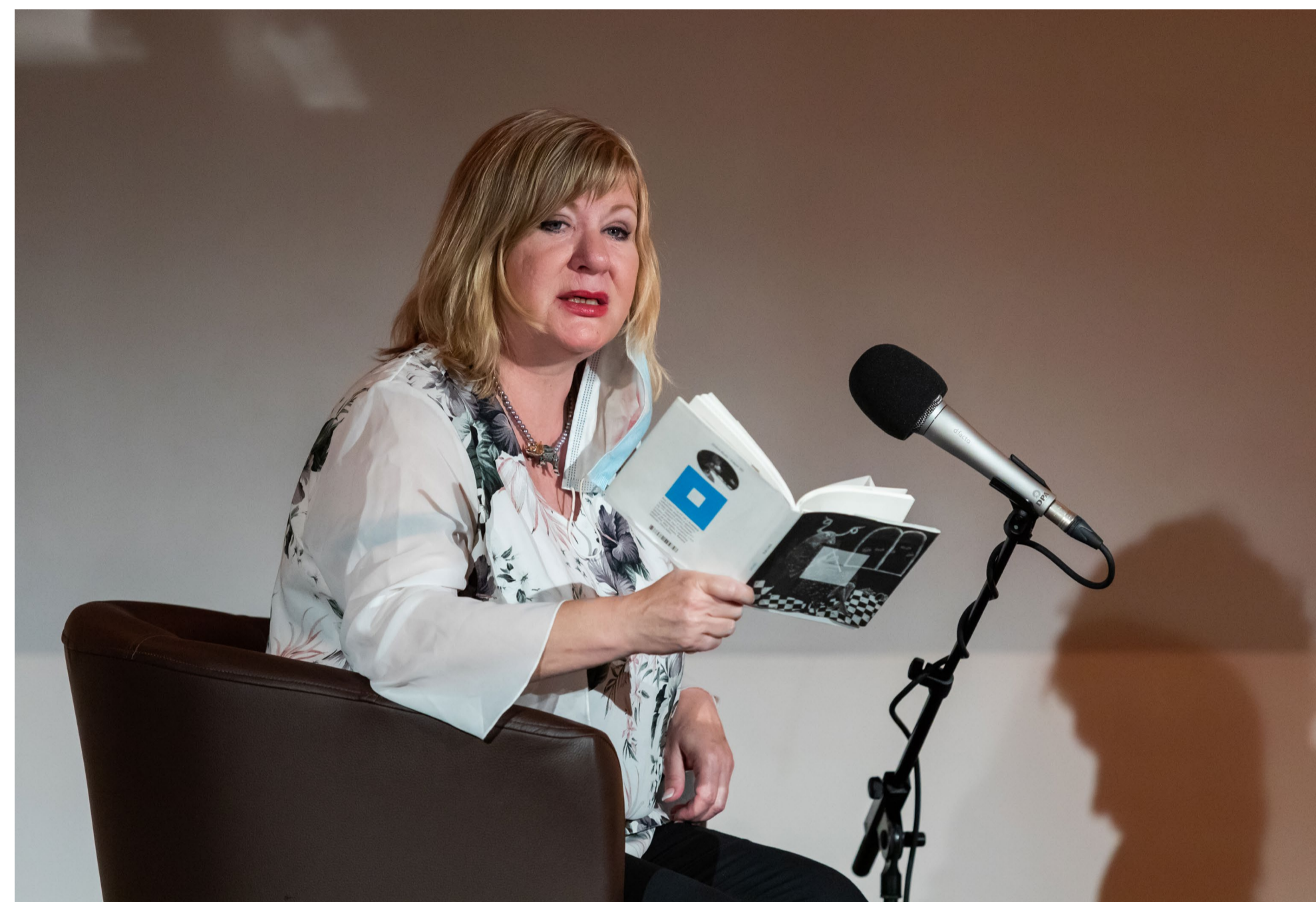
Medzinárodný literárny festival NOVOTVAR 2020

Najväčší medzinárodný divadelný festival na Slovensku sa orientuje na netradičné, inšpiratívne a divácky náročnejšie scénické diela prevažne z európskych krajín. Každoročne prezentuje sériu pozoruhodných diel zahraničných hostí a tematický výber zo slovenskej tvorby. Podujatie sa programovo zameriava na prezentáciu nových tendencií v súčasnom divadelnom umení a predstavovanie nových domácich a zahraničných tvorcov.