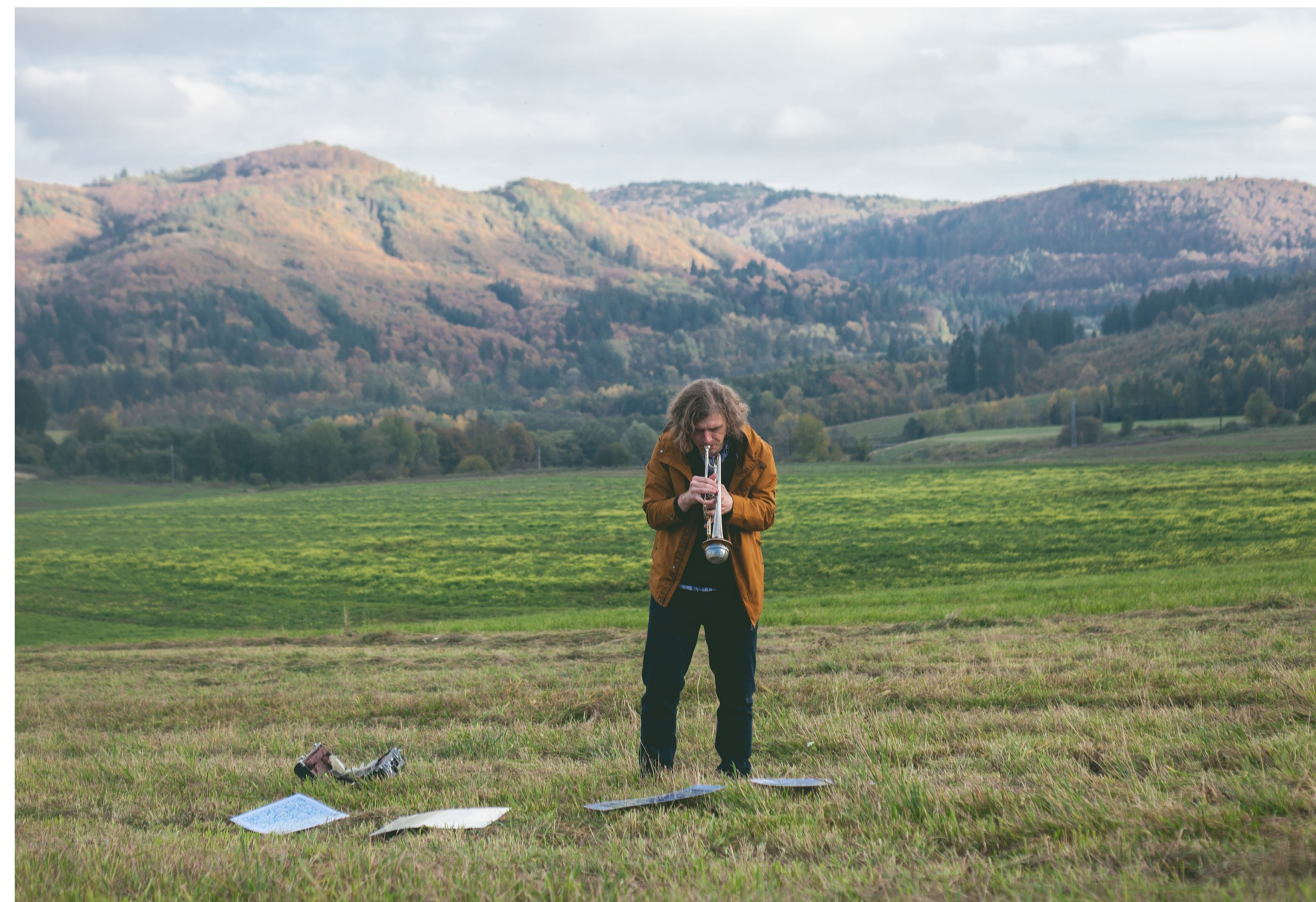
JAMA – 74. ročník Milana Adamčiaka

Medzinárodný literárny festival NOVOTVAR sa sústreďí na popularizáciu súčasnej domácej aj zahraničnej literárnej tvorby. Už piatykrát predstavil autorky a autorov, ktorým v uplynulom roku vyšla nová knižná publikácia, autorov priradených k predstaviteľom najprogresívnejších tendencií súčasnej tvorby, ako aj najmladšiu nastupujúcu generáciu – debutantky a debutantov. Popri primárnej orientácii na literatúru má podujatie aj multižánrový presah smerom k hudbe, divadlu a performancii. Aj v roku 2020 bolo súčasťou podujatia odovzdávanie ocenenia národných cien za poéziu Zlatá vlna aj vyhlásenie výsledkov súťaže Básne SK/CZ 2020.