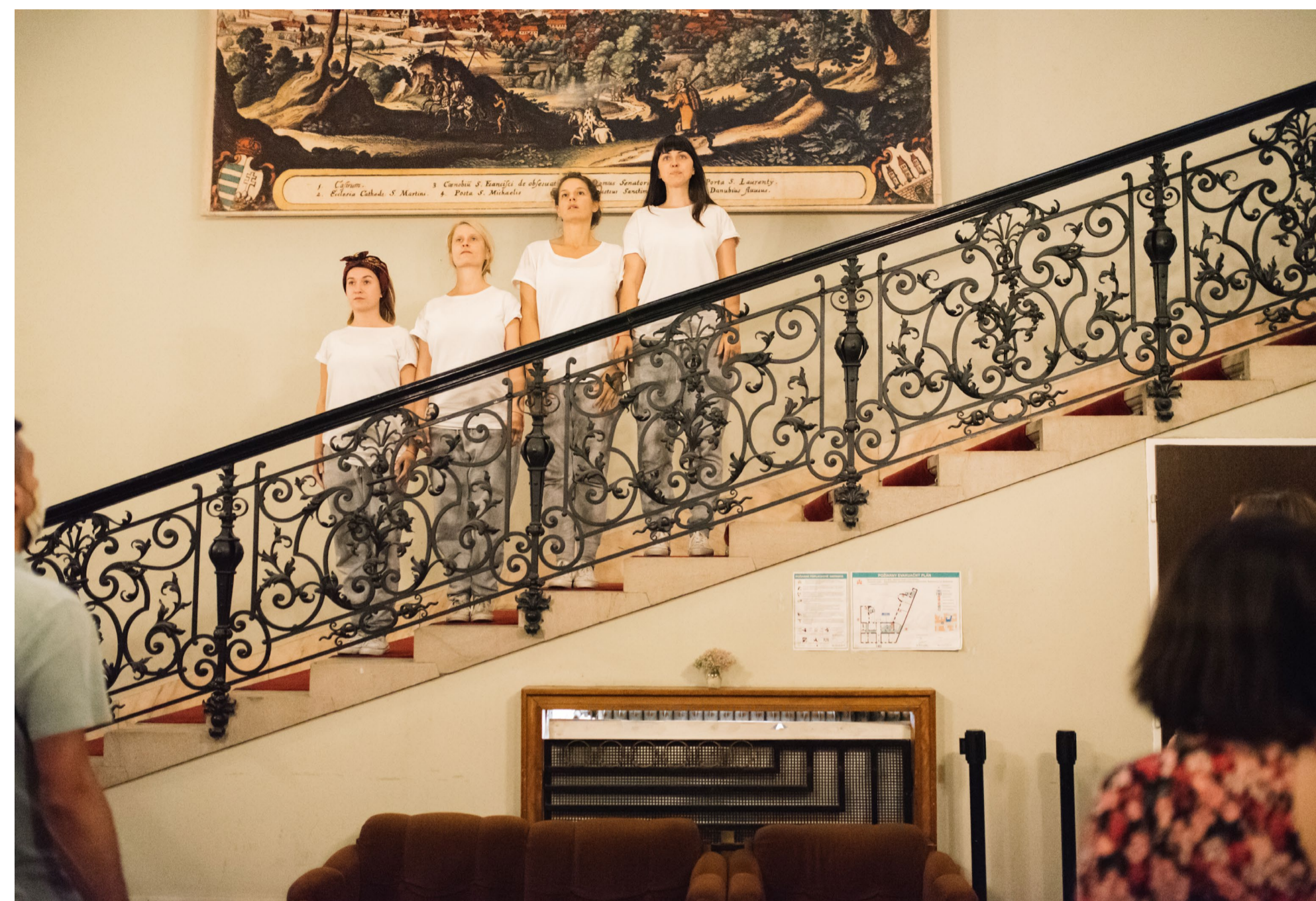
SHOWCASE Divadla NUDE: venované ženám

Anasoft litera je najprestížnejšou literárnou cenou na Slovensku udeľovanou za najlepšie slovenské prozaické dielo vydané