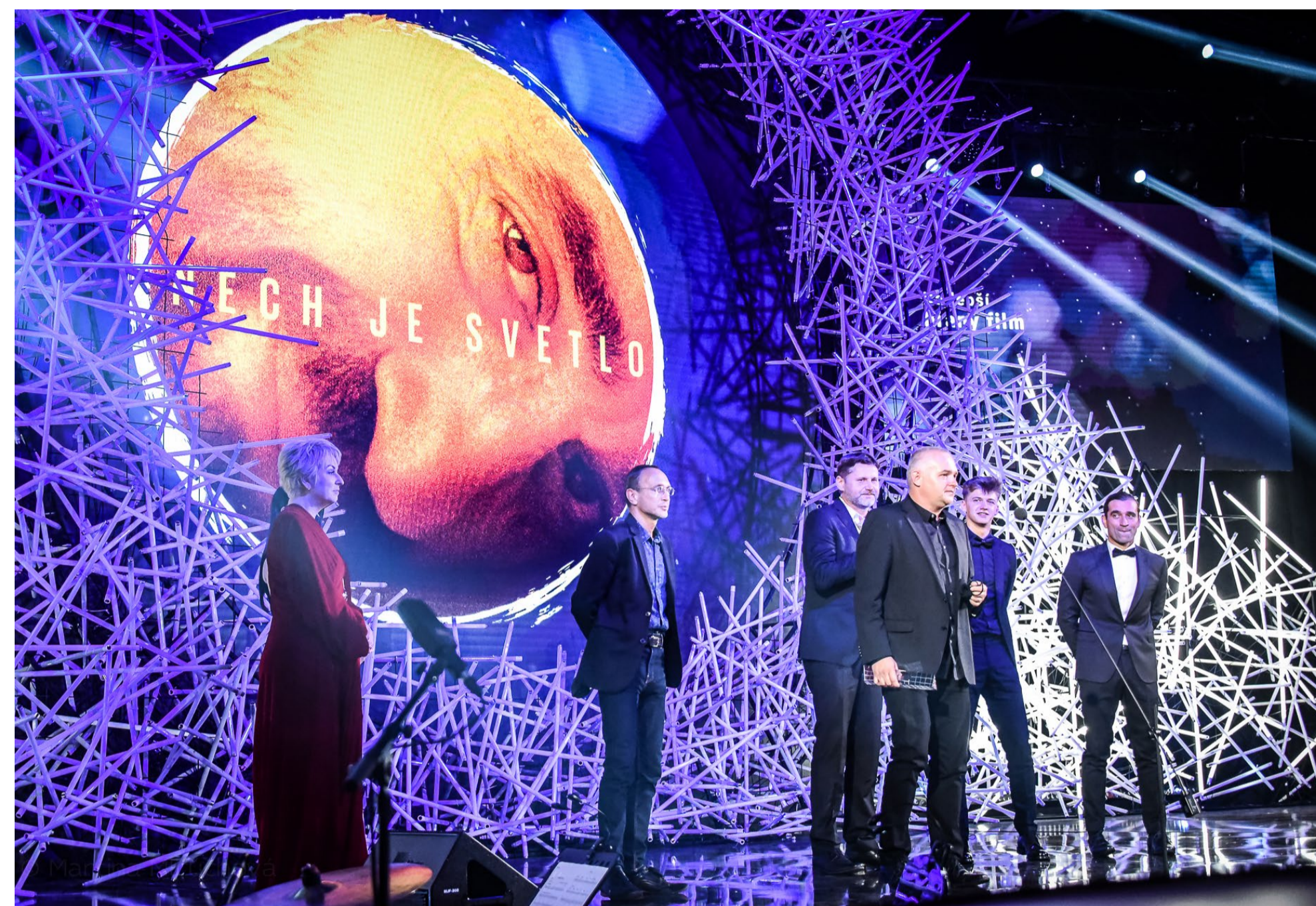
Odovzdávanie ocenení Slnko v sieti 2020

Občianske združenie literarnyklub.sk sa zameriava na podporu súčasnej pôvodnej literárnej tvorby s umeleckou ambíciou, jej prepájanie s inými kreatívnymi oblasťami a napojenie na širší kultúrno-spoločenský kontext. Cieľom podujatí organizovaných pod hlavičkou literarnyklub.sk je zintenzívniť kontakt medzi