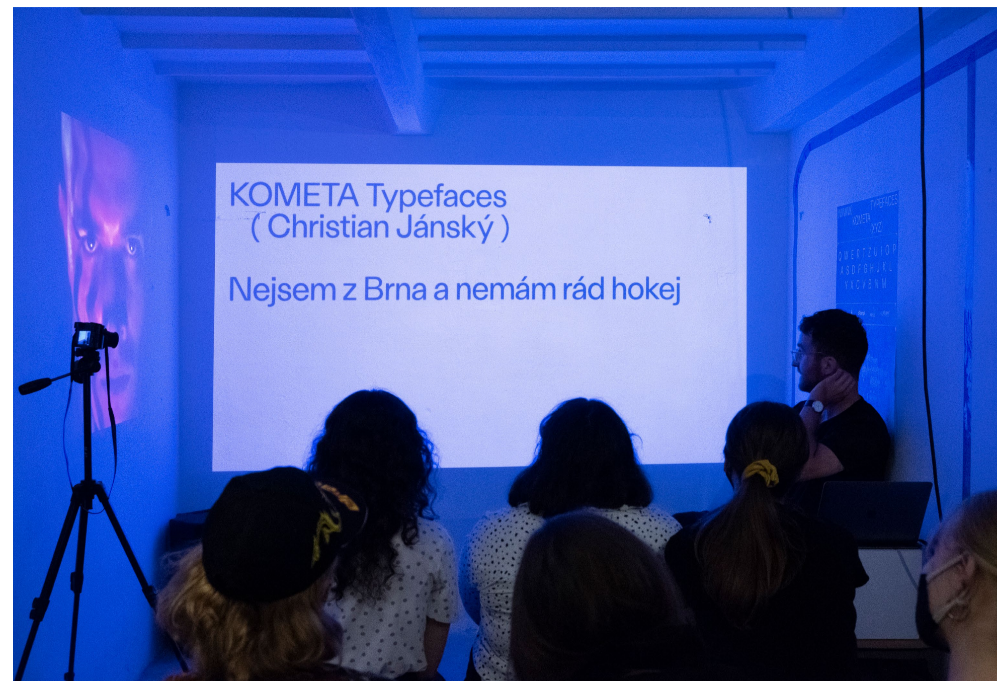
Jeseň v Typogaráži

Združenie literárnych prekladateľiek a prekladateľov, redaktoriek a redaktorov DoSlov sa systematicky venuje zvyšovaniu povedomia o prekladateľskej práci a redakcii literatúry a zároveň zvyšovaniu povedomia literárnych prekladateľov a redaktorov o ich autorských právach, obhajobe ich dôstojných pracovných podmienok a férovému nastaveniu zmluvných podmienok medzi autormi