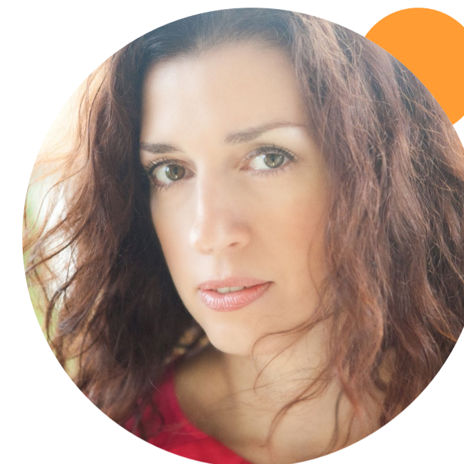
Eva Borušovičová za režisérovo

Filmová režisérka, scenáristka a spisovateľka sa venuje tiež dramatickej tvorbe a divadelnej réžii. Zároveň dlhodobo pôsobí ako pedagogička na Filmovej a televíznej fakulte VŠMU. Ako filmová tvorkyňa sa zameriava najmä na hranú tvorbu, je režisérkou a scenáristkou filmov Vadí nevadí (2001) a Modré z neba (1997), vytvorila tiež scenár koprodukčného celovečerného filmu Jánošík – Pravdivá história (2009). Napísala divadelné hry 69 vecí lepších než sex (2013), Štefánik – slnko v zatmení (2017) a Zajačík (2020), ktorých inscenácie zároveň režijne naštudovala. Venuje sa aj písaniu a réžii rozhlasových hier, napríklad Vzkriesenie (2018), Otec vlasti (2019), či Patriarchát (2020). Pravidelne publikuje v printových médiách aj na internete, napríklad Autorská strana v denníku SME. Je autorkou kníh Urobíme všetko, čo sa dá (2009), Jánošík – Pravdivá história (2009) a Do plaviek (2018).