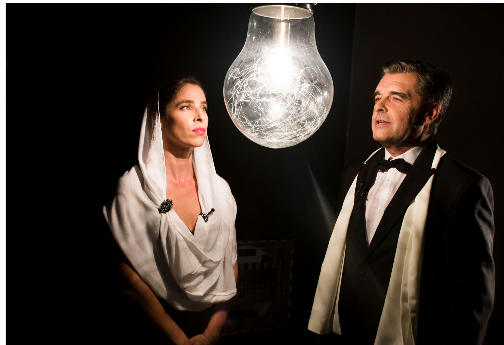
Odovzdávanie ocenení IGRIC 2020

Festival Mesiac fotografie sa v roku 2020 uskutočnil po jubilejný 30. raz. Podujatie, ktoré je súčasťou Európskeho mesiaca fotografie spolu s najdôležitejšími fotografickými festivalmi (Paríž, Luxemburg, Berlín a i.), každoročne uvedie sériu výstav domácich a zahraničných fotografov. Ide o platformu vyhľadávania profesionálkami a profesionálmi z odvetvia – fotografmi, kurátormi, teoretikmi a študentmi fotografických odborov – a zároveň o podujatie populárne medzi fanúšikmi fotografického umenia. Prezentovaná tvorba reflektuje súčasné aj historické spoločenské udalosti, demonštruje nové smery a techniky v oblasti fotografie, prieniky fotografie a výtvarného umenia a stimuluje reflexiu nových podnetov v nazeraní na médium fotografie.