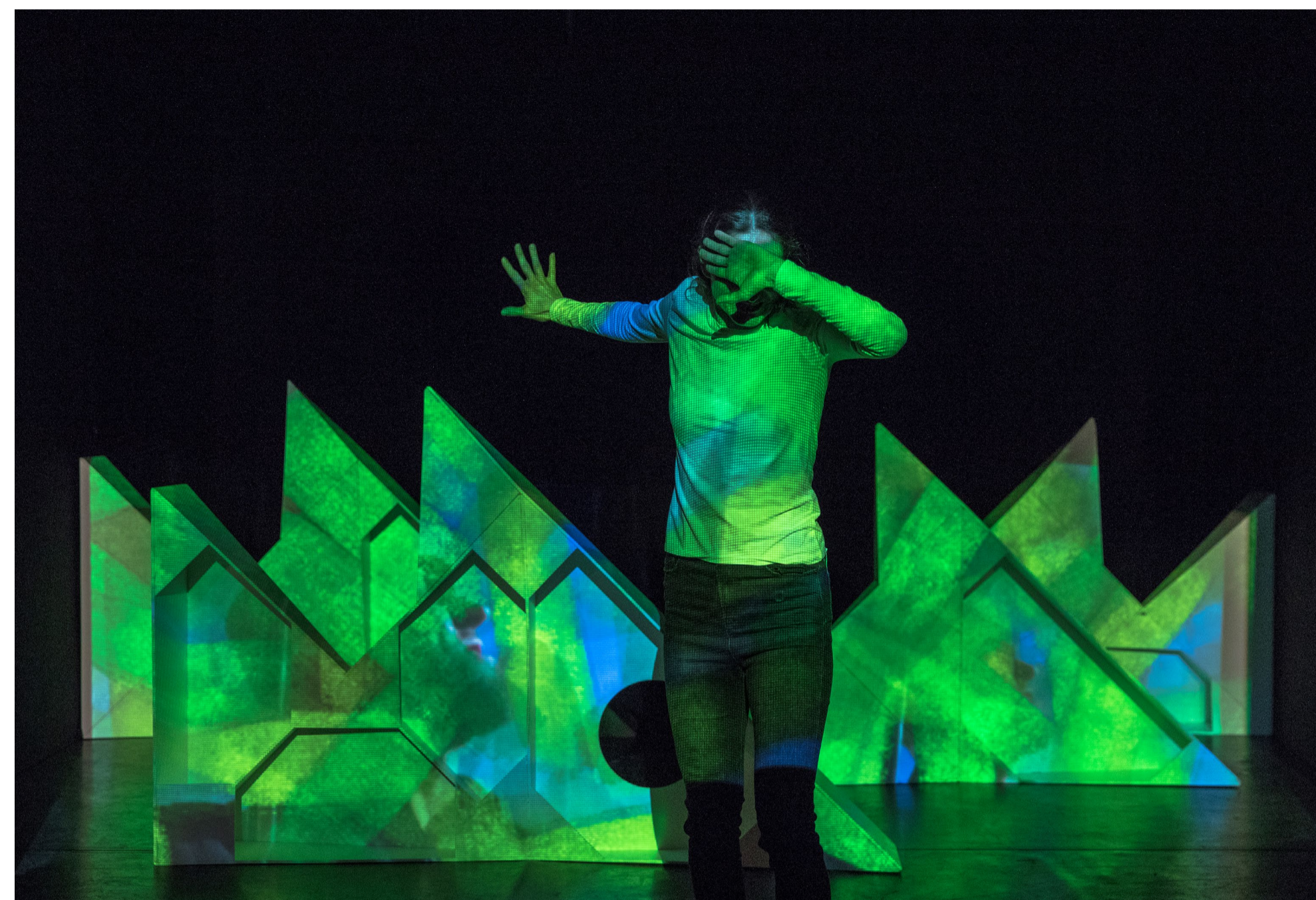
Inscenácia Bytie 2 zoskupenia Príchod Godota

Jeseň v Typogaráži je program kultúrno-vzdelávacích a prezentačných aktivít – prednášok, workshopov a diskusií, ako aj krátkych umeleckých rezidencií a výstav pre študentov i profesionálov z oblastí typografie, knižného a grafického dizajnu. V roku 2020 sa uskutočnili dva z plánovaných výstupov, projekt sa pre pandemickú situáciu nepodarilo zrealizovať v celom plánovanom rozsahu, a preto jeho výstupy pokračujú aj v 2021.