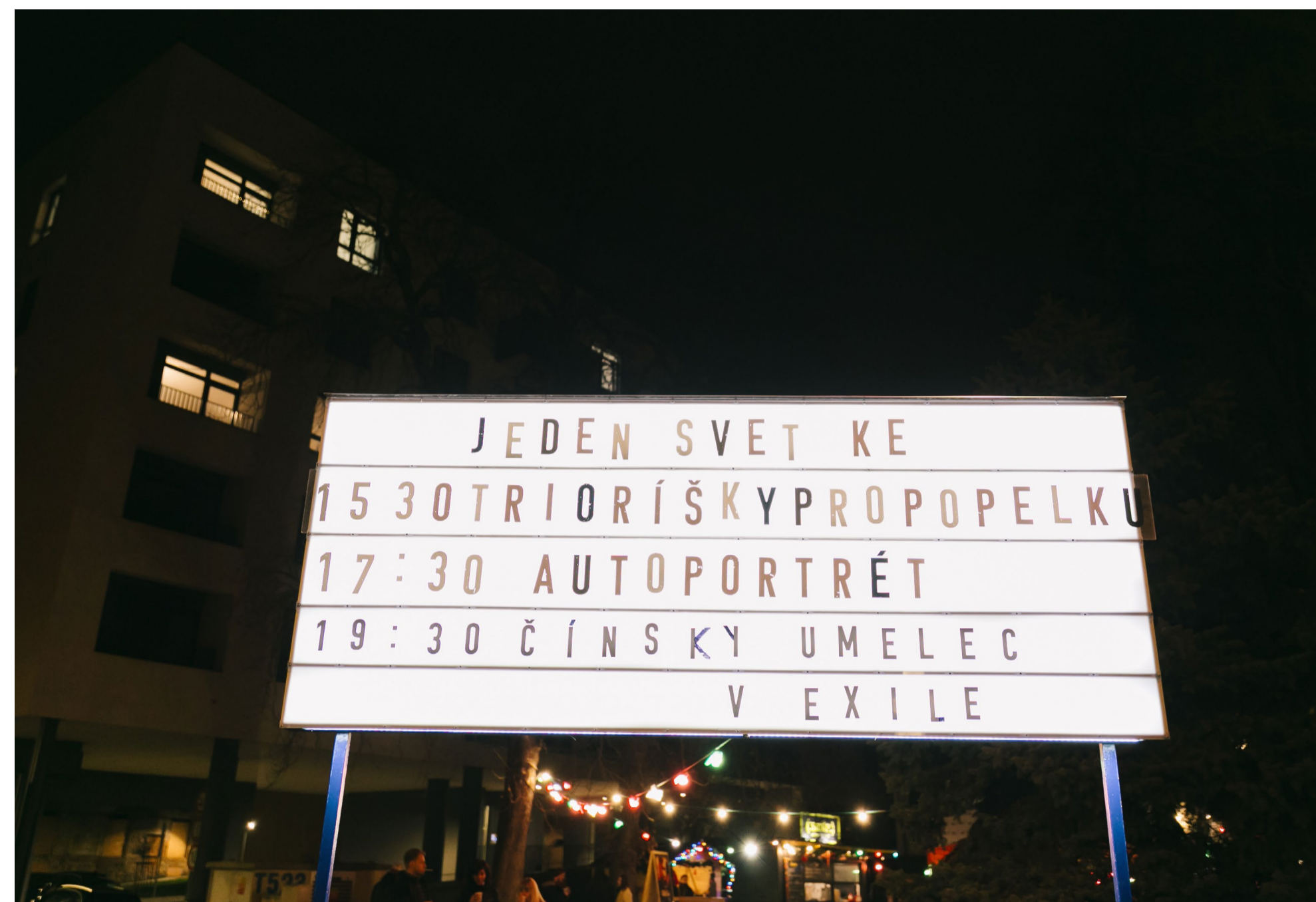
Jeden svet Košice 2020

Prednáškový cyklus Ako vzniká kniha sa zameriava na jednotlivé zložky a fázy vydavateľského procesu. V roku 2020 sa odohrala prvá zo série plánovaných prednášok. V spolupráci s LITA sa organizátori venovali autorskoprávnej problematike a téme licenčných zmlúv spojených s vydávaním kníh, súčasťou prednášky bolo tiež priblíženie procesu prekladu diel – od výberu textu