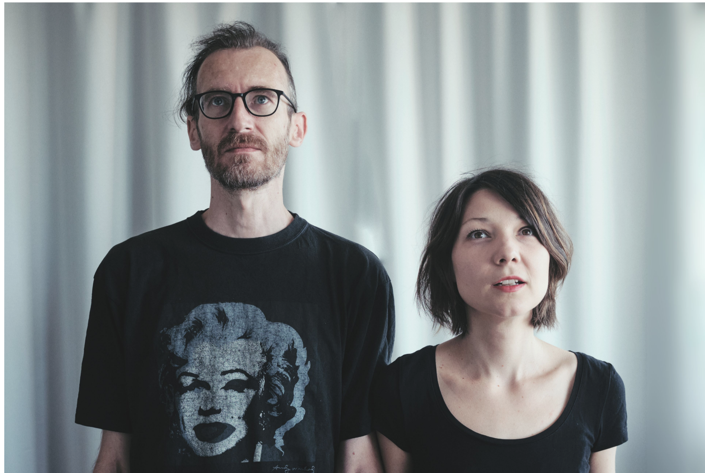
Lubomír Panák a Zuzana Husárová, autori Lizy Gennart