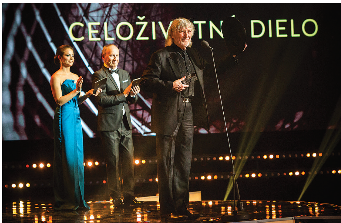
Udelenie ceny Slnko v sieti za výnimočný prínos slovenskej kinematografii Jurajovi Jakubiskovi, 16. apríl 2016