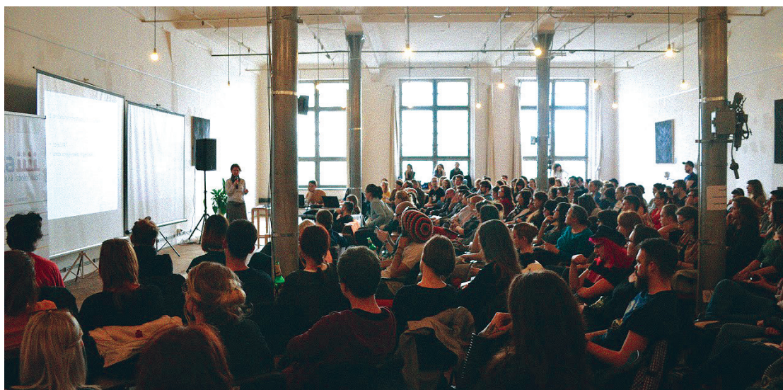
Konferencia Tajomstvá marketingu pre výtvarníkov v Cvernovke