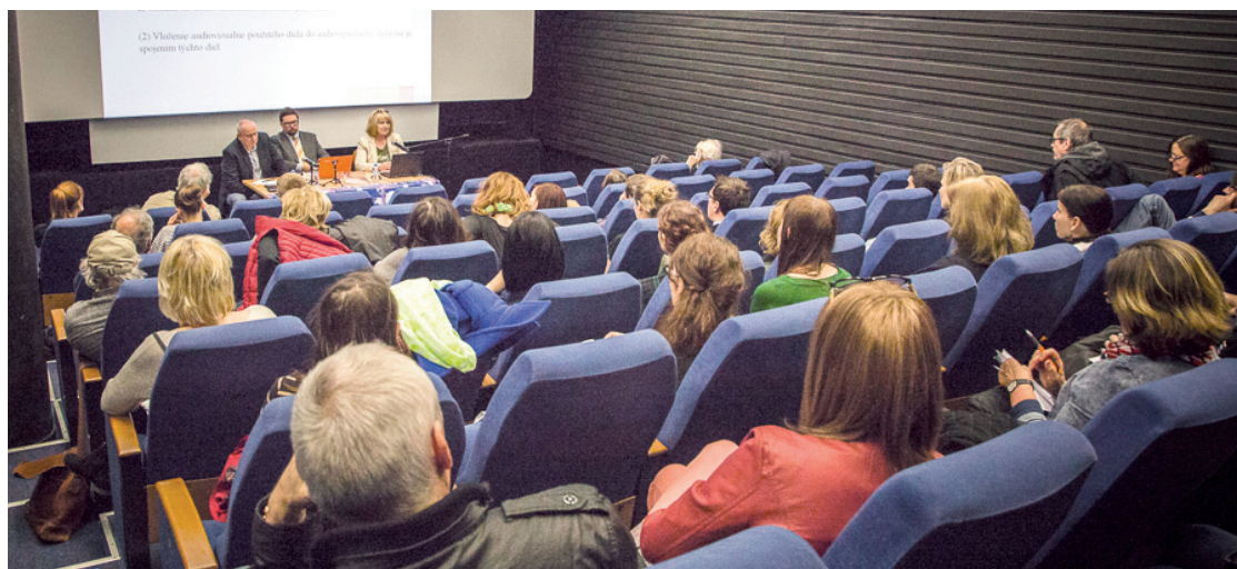
Diskusia o úprave autorskoprávných vzťahov v rámci podujatia SFTA Týždeň slovenského filmu, 14. apríl 2016

http://www.lita.sk/magazin/panelova-diskusia-audiovizia