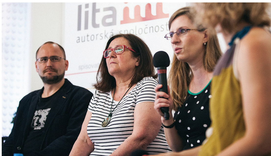
Beseda na knižnom festivale BRaK, 4. jún 2016