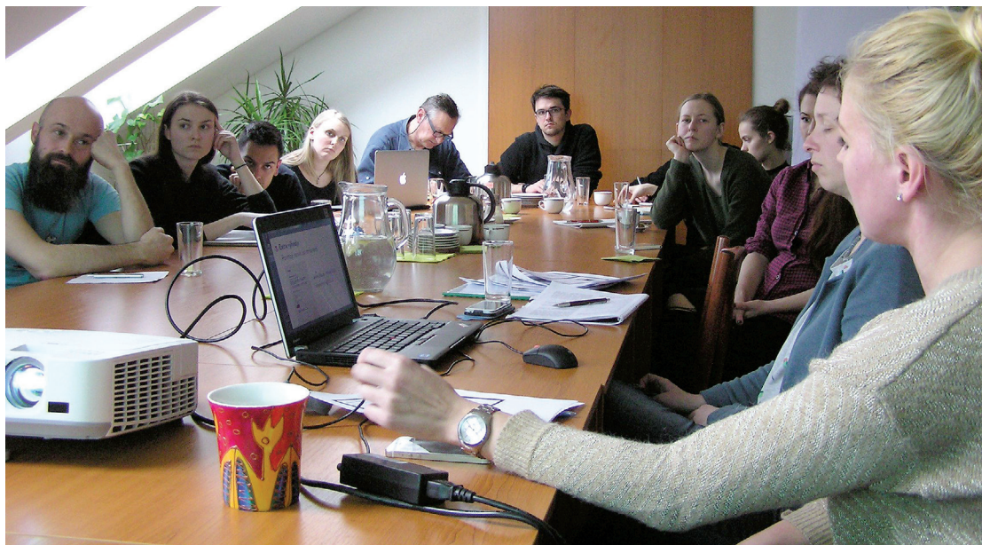
Diskusia o autorskom práve pre Katedru fotografie a nových médií VŠVU v priestoroch LITA

na uskutočnenie tohto vzdelávacieho podujatia poskytla príspevok z Fondu na podporu sociálnych, kultúrnych a vzdelávacích potrieb.