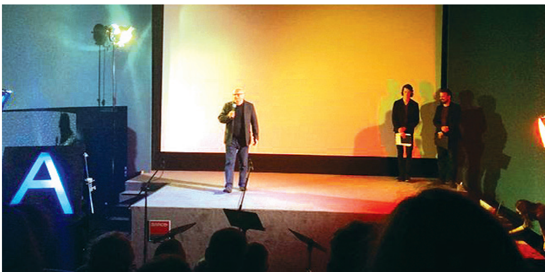
Otvorenie Festivalu Áčko 2016 organizovaného VŠMU

- Na jeseň 2016 (28. - 30.10.2016) sa v Piešťanoch uskutočnila Letná škola prekladu na tému „Jazyková a kultúrna rozmanitosť v preklade a využitie nových technológií“. LITA